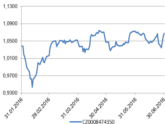
Vývoj hodnoty podílového listu